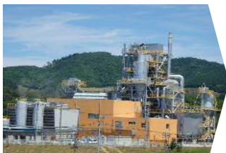
バイオマス発電所 他関連施設