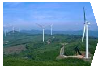
江津高野山 風力発電所