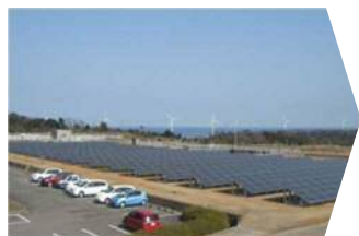
西部事務所と 太陽光発電所