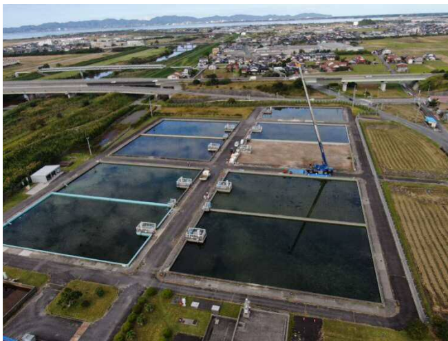
緩速ろ過池全景写真