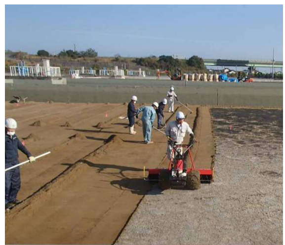
緩速ろ過池砂削り状況