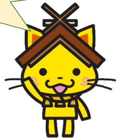
島根県観光キャラクター「しまねっこ」